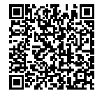
「源泉所得税の納税手続」

納付手続は、次のとおり様々な方法がありますので、ご自身で選択し、納付手続を行ってください。なお、各納付手続の詳しい内容については、国税庁ホームページ「源泉所得税の納税手続」( https://www.nta.go.jp/users/gensen/nencho/index/gensen_nouzei/cashless.htm )をご覧ください。